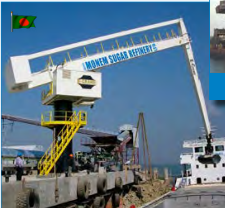
Série 700: 4264 PD-E