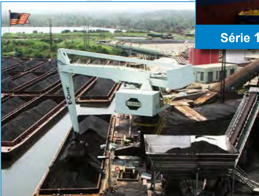
Série 2000: 18246 PD-E