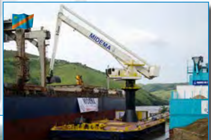
Série 1500: 9359 PD-E