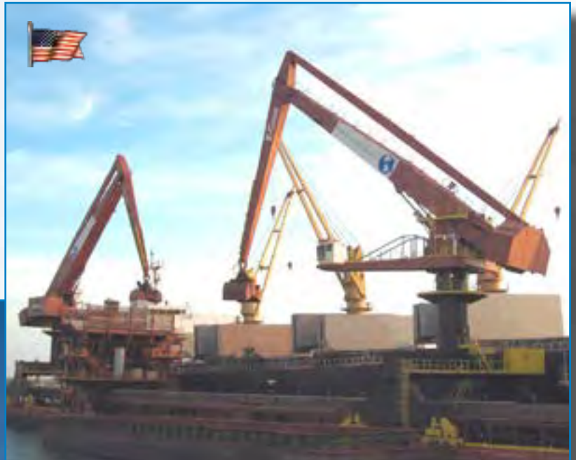
Série 2000: 2 x 18450B GA-E